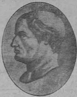
Mecenas, según una antigua medalla romana. Mecenas fue amigo de Augusto y protector de Horacio.

Como hemos dicho, el lugar queda cerca de la población de Licenza, a diez millas de Tivoli, esto es, el famoso Tibur de Horacio y de los antiguos romanos. Se cree que Licenza es la Digenina de los romanos. Un visitante horaciano ha dicho que los alrededores responden perfectamente a la descripción que da Horacio, pero lo que es la casa parece ser considerablemente