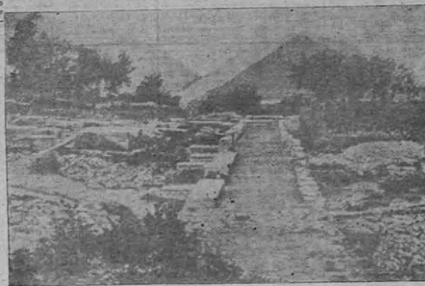
Las ruinas de la villa de Horacio, construida y obsequiada por Mecenas.

Al generoso Mecenas le encantaba que sus amigos compartieran con él sus riquezas, sus vinos y sus tesoros artísticos. Nadie como el viejo Quintus Horatius Flaccus, mejor conocido por nosotros con el nombre de Horacio, apreció la generosidad de Mecenas. Casi todas las odas y epístolas que escribió hablaban de algo que le dio Mecenas o que obtuvo por medio suyo. También le escribió odas al emperador Augusto pintándolo como el más grande emperador que ha existido, poniendo especial entusiasmo en alabar ciertos triunfos en la carrera de su majestad, en los cuales fue aconsejado por Mecenas. Esta levantaba al consejero en la estima del emperador, que le bañaba con aversea riquezas. El generoso