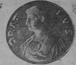
Medalla en que se grabó el busto de Horacio, y estas palabras que siempre hallé en un bosquejo. Los fines propicio me han concedido algo nada. Soy feliz.

¡Eran, amigos, mis sueños del día: un no muy grande pedazo de tierra