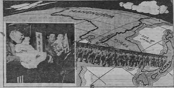
Resoldados, armados para hacer resistencia a los japoneses, están siendo enviados por el Japón a colonizar el norte de Manchuria. Véase el primer contingente de 450 abajos, a la derecha; y a la izquierda, algunos despididos de sus hijos.

París, 12. — El gabinete, bajo la presidencia de Herriot, discutió hoy el proyecto de seguridad y desarme que va a presentarse a la conferencia de Ginebra. Después del diario "Echo de Paris", se acordó introducir algunas reformas, de modo que el texto definitivo será aprobado definitivamente por el gabinete el lunes. Se decidió también encargar al delegado francés Massigli para que presente el plan a la conferencia de Ginebra.