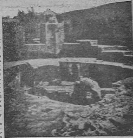
Ruinas de uno de los tres baños que ayudaron a los amigos de Horacio a recobrar de los efectos de la hospitalidad del poeta.

brario de Julio César y primer emperador romano. En varias ocasiones Augusto dejó a Mecenas hecho cargo de Roma. La fortuna de Mecenas fue la más grande de su tiempo en todo el mundo entonces conocido. Tenía una inabarcable disposición generosa y nunca se cansó de gastar sus riquezas protegiendo artistas y poetas. Sus palacios estaban llenos de pinturas, estatuas y otros tesoros de arte hechos por los más consumados maestros de su tiempo. También le gustaba coleccionar obras de maestros antiguos y entre sus galerías se destacaban esculturas a cuyo pie se leían las firmas de Fidias y Praxiteles.